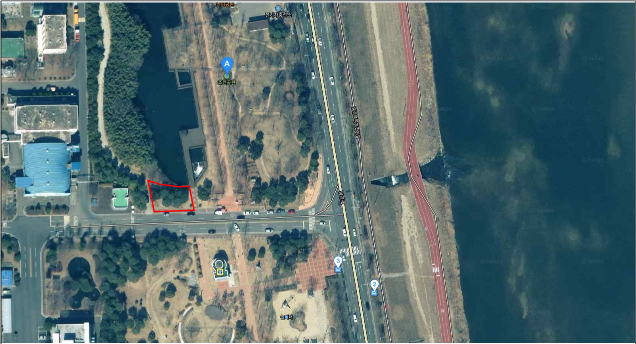
진주시 대한민국 정원산업박람회 내 서울정원 조성 예정 대상지 위치도