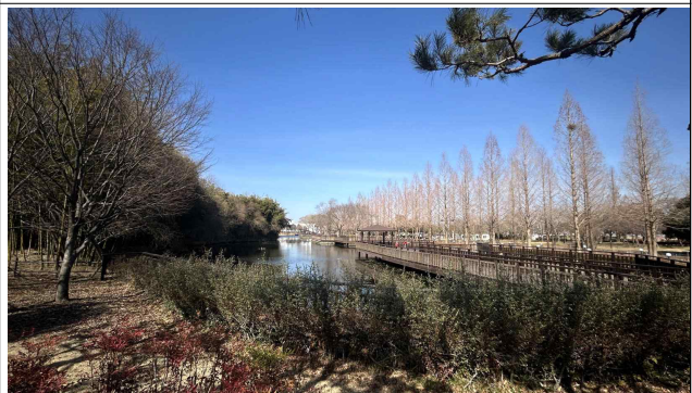
진주시 대한민국 정원산업박람회 내 서울정원 조성 예정 대상지 현황사진