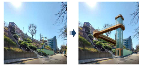
[1단계] 관악구(봉천동) 계획(안)