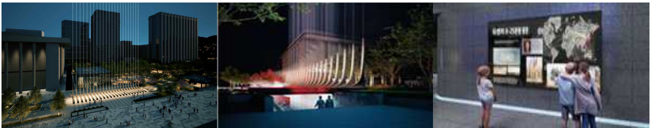
<감사의 빛 23(지상)>