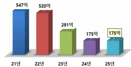
< 연도별 지원규모 >