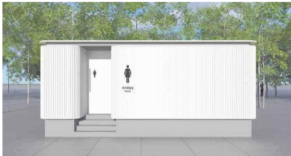
[일반형 이동형 화장실]