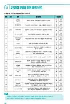
<발달장애인을 위한 생활기술 프로그램 모듈: 생활금융편(2025년 개발)>