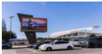
<BMO MLK 전광판>