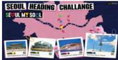
<서울관광 홍보부스 시안 이미지>