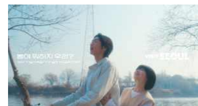
<대시민 캠페인 송출 영상 '봄편'>