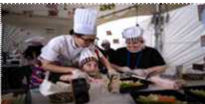
<시민 체험 프로그램 운영>