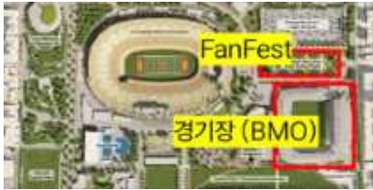
<LA BMO 스타디움 팬페스트 위치>