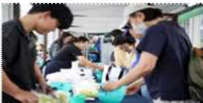
<유명 셰프/식품명인 초빙 콘텐츠>