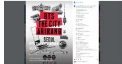
<BTS컴백 행사 연계 홍보>