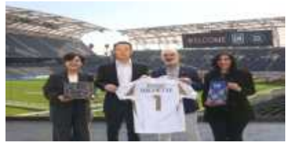
<업무협약식 예시 이미지>

작 성 자 | 국제관광·MICE본부장 원종 ☎3788-0840 글로벌마케팅팀장 박진혁 ☎0821 담당 황순호 ☎8140