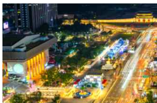
<서울쌈머비치 야간 전경>