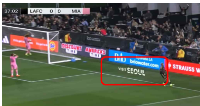
<LAFC 개막전 버추얼 골라인 카펫>