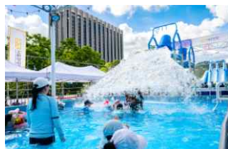
<물놀이 시설 운영>