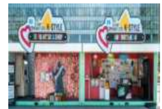
<팝업 부스 운영>