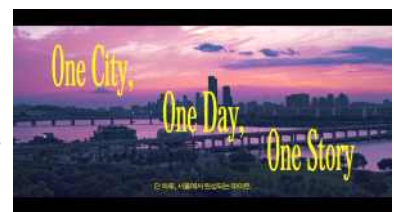
<서울에서 사랑이 되나요?>