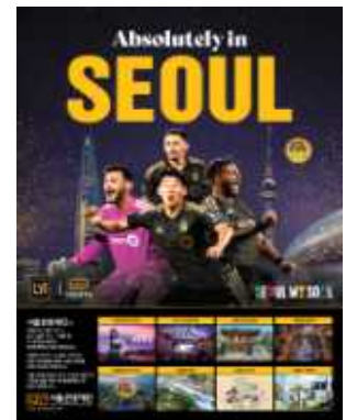
<SEOUL X LAFC 광고시안>