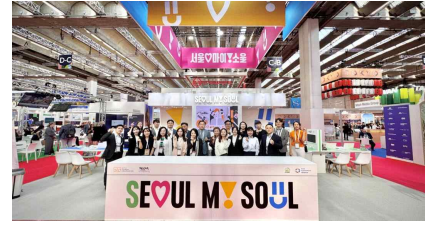
<서울 홍보관 운영>

작성 자 국제관광·MICE본부장 원종 ☎3788-0840 MICE전략팀장 곽도휘 ☎0826 담당 박정운 ☎0862, 이현아 ☎0872