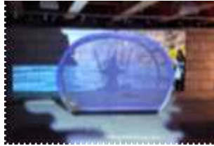
<유관기관 협업 전시>