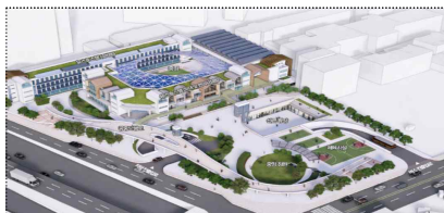
강서 (구)공항고 유스호스텔 리모델링