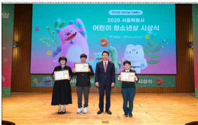
어린이 날 기념행사(5.8.)