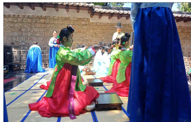
성년의 날 기념행사(5.18.)